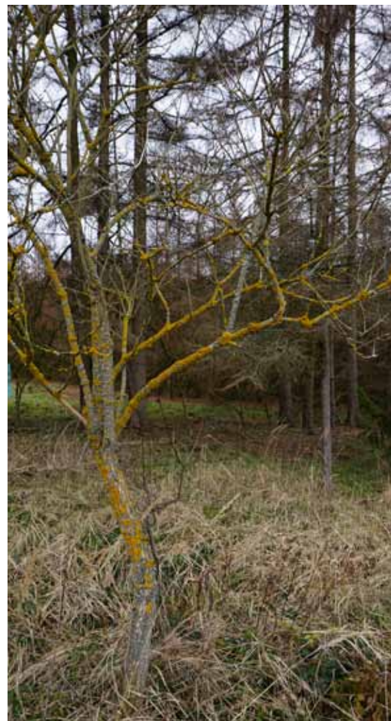
Porosty žlutého lišejníku terčovníku na keři bezu ukazují na zvýšený vstup reaktivních forem dusíku do ekosystému – zde zřejmě z okolních polí. Souvislost mezi zvýšeným vstupem dusíku a oslabenou imunitou porostů prokázala již celá řada studií. V pozadí obrázku lze vidět mladé kalamitní smrkové porosty. Fotografie z okolí Černé hory.

Za současné situace postupného kalamitního rozpadu porostů a rychlých změn podmínek může lesník při obnově porostů vystupovat jako klíčový tvůrčí činitel, který nasměruje nový les k vyšší odolnosti, samozřejmě ideálně s maximálním využitím přirozených procesů, zahrnujících například využití porostů přípravných dřevin.