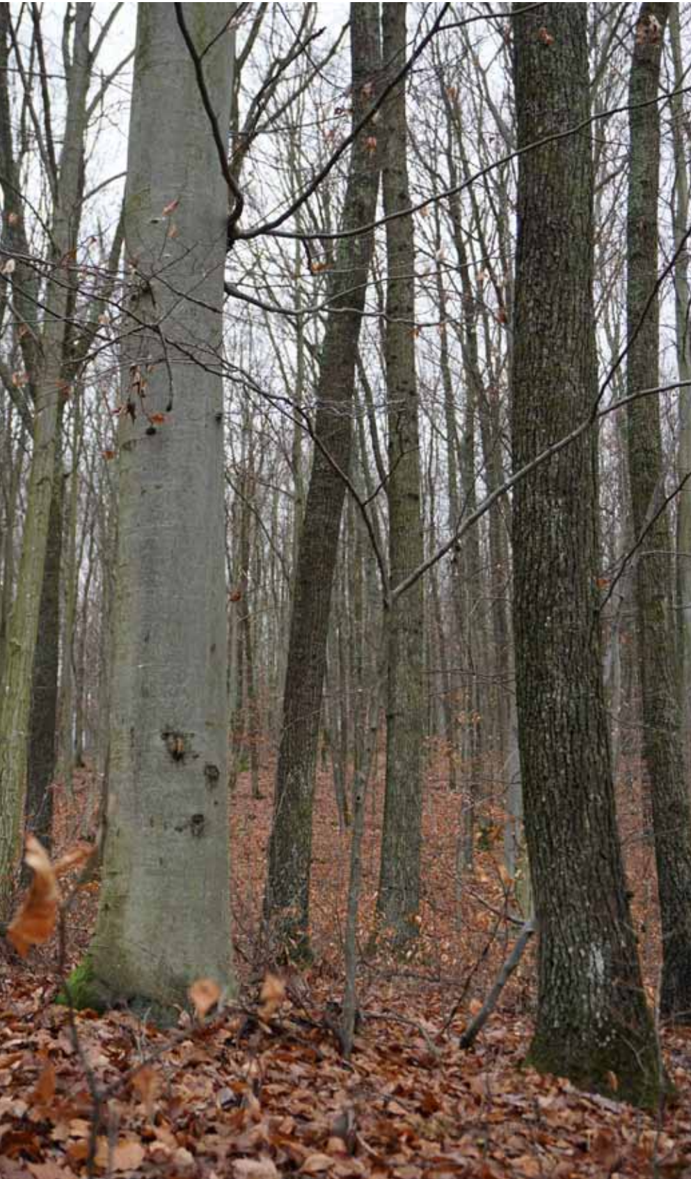
Směs dubu a buku, doplněná o další dřeviny, které mají schopnost zvýšit odolnost porostu, představuje pro velkou část území ČR vhodnou adaptaci na kombinované působení stresu. Fotografie ze smíšených hospodářských porostů na středním Slovensku.

ších horizontů. To je problematické z několika důvodů, například proto, že k tomu, aby se strom dostal k živinám uzamčeným v půdní organické hmotě, potřebuje pomoc mykorrhizních či hniložijných hub. První skupina je však silně oslabena. Druhý obrovský problém vyvstává s příchodem sucha: svrchnější organické horizonty jsou náchylné k vysychání. Když se tak po roce 2000 počasí stále více rozkolísává, přibývá jarních such a letních veder a teploty na lokalitě stoupají daleko za mez, která je pro smrk jako původně horskou dřevinu snesitelná, imunitní systém stromu zkolabuje. Volná místa v půdě po ochabujících mykorrhizních houbách obsadí václavka, do kořenů a kmene proniká i kořenovník či pevník. Když strom vycítí, že přichází nápor kůrovce, už není schopný se ani účinně bránit. A tak těch několik kapek pryskyřice stékajících po kmeni představuje poslední výkřik před přicházející smrtí lesa.